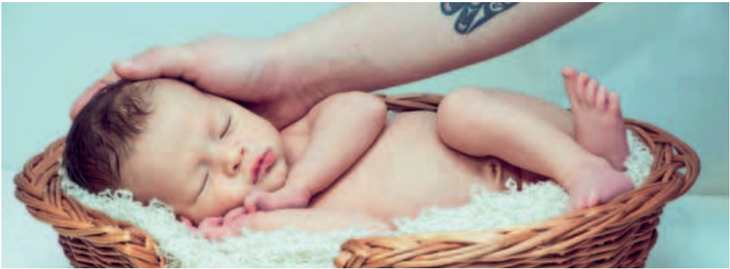
v.l.: Inhalte der Bilder