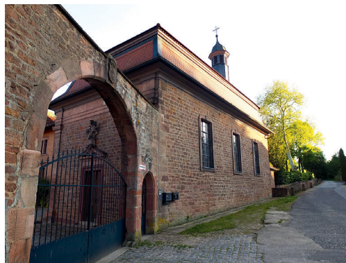
Kapelle „Vom guten Hirten“ Unterbessenbach 4