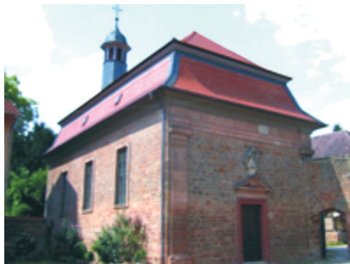
Kapelle „Vom guten Hirten“ Unterbessenbach 4