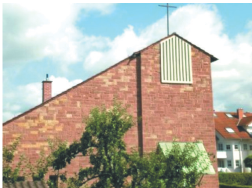
Johanneskirche, Johannesplatz 7, Goldbach