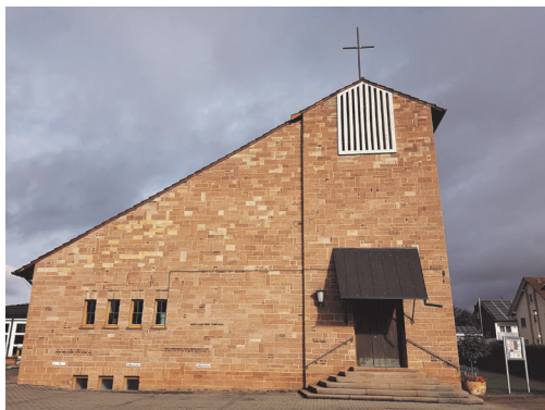
Johanneskirche, Johannesplatz 7, Goldbach